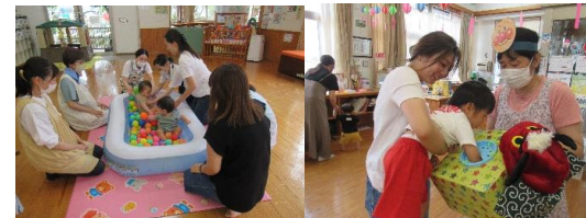
♡親子で楽しんでいます♡

※毎週火・水・金曜日は専任の保育士が相談をお受けします リモートでの相談もできるようになりました。