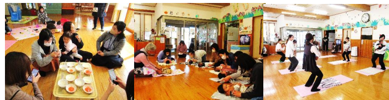
♡親子で楽しんでいます♡